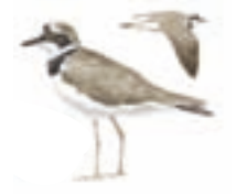
● Chorlitoje chico ( Charadrius dubius ) ● Little Ringed Plover