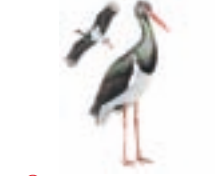
● Cigüeña negra ( Ciconia nigra ) Black Stork