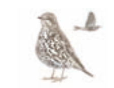
● Zorzal charlo ( Turdus viscivorus ) ● Mistle Thrush