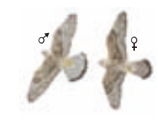
● Cernicalo vulgar ( Falco tinnunculus ) ● Common Kestrel